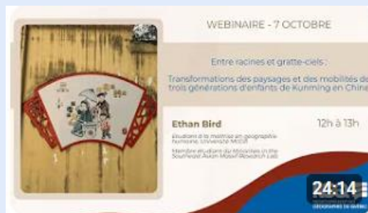
Ethan Bird (M.A-McGill) 7 octobre 2025