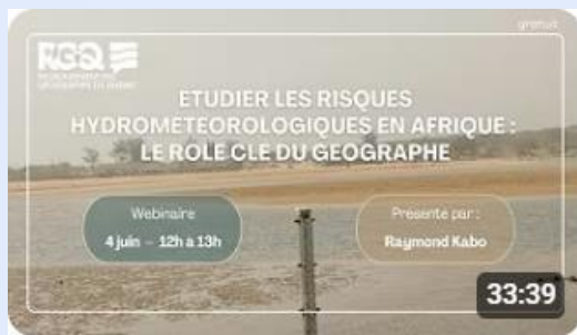
Raymond Kabo (Ph.D-ULaval) 4 juin 2025